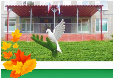
СХЕМА БЕЗОПАСНЫХ МАРШРУТОВ МОУ СОШ №4